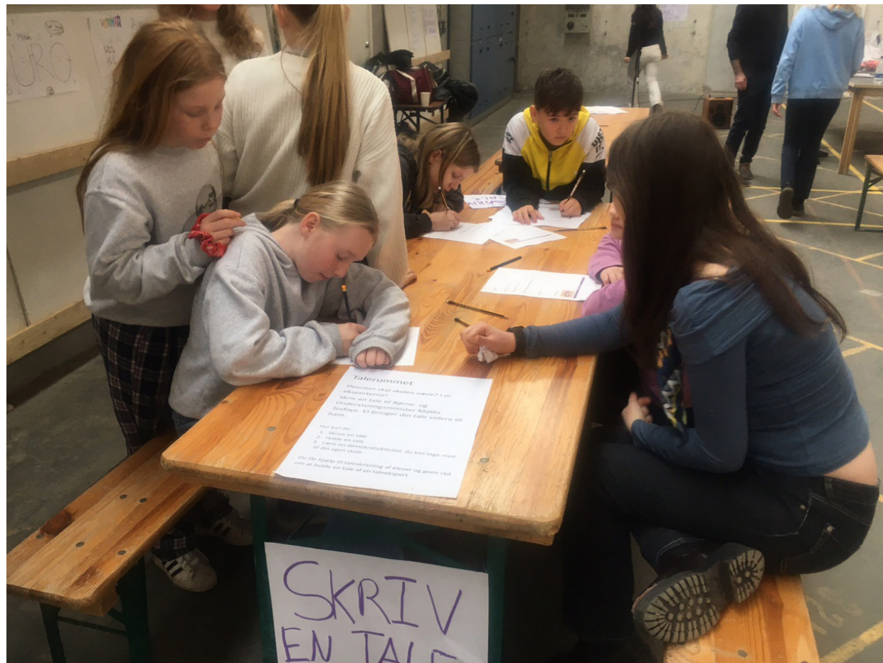
På en af dagens destination kunne elever skrive taler til Undervisningsministeren med hjælp fra elevrådet på Lindevangskolen. Elevrådet afleverede elevrådet efterfølgende, de i alt 155 taler til ministeren.

Vi har også haft fokus på 'ikke-fund' - forstået som temaer, der er udeladte af informanterne, men som har plads i voksnes diskurser, bekymringer og interesser på børns vegne. 'Ikke-fund' kan således være et fund med betydning, hvis der er åbenlyse modsætninger mellem det børn og unge skriver frem - og det som voksne finder vigtigt og centralt.