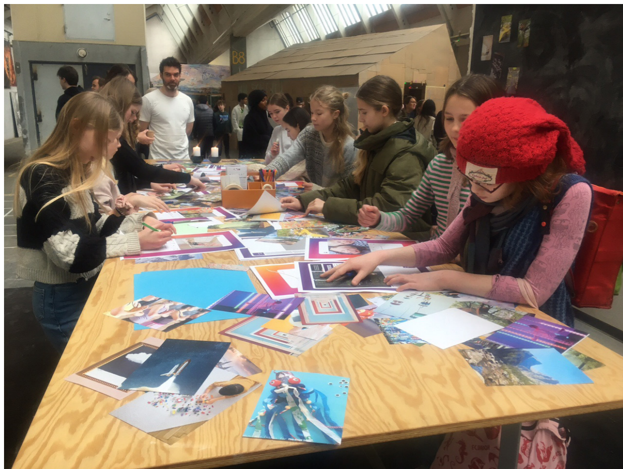
Arkitektfirmaerne NERD og MATTERS inviterede elever og fagfolk til at give visuelle bud på trivselsskabende rum og arkitektur i skolen.

Ud af de i alt 457 udsagn er der ikke et eneste negativt udsagn om skolekammerater. Tværtimod efterspørges der mere mulighed for det, vi her analytisk set vil kalde for rum til socialitet med de andre. Dette 'ikke fund' er på linje med vores observation på SPOR 10 den 15. marts. Vi lukkede over 600 elever ind i hallerne uden vagtværn, ordensregler og hævede stemmer. Eleverne forlod stedet i samme orden – som da de ankom. Ingen affald på gulvet, ingen hærværk, ingen slåskampe, ingen råben og skrig. Den observation står som kontrast til (visse) diskurser om tidens børn og unge som individer, der ikke har lært ordentlighed, høflighed, fællesskab respekt og disciplin hjemmefra.