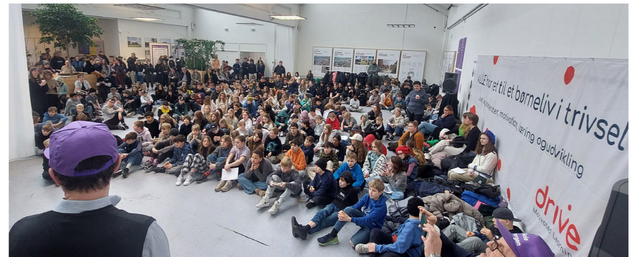
Til 'Skole i morgen' d. 15.03. deltog 650 elever fra 5. til 8. klasse. Her bydes det første rul af 350 elever velkommen.

15. marts 2024 mødtes 1250 voksne, børn og unge som legede, snakkede og skabte dynamiske og inviterende aktiviteter på dagen, som man enten allerede har indført på sin skole - eller som man gerne vil have på sin skole. Til 'Skole i morgen' -arrangementet var der skabt 23 destinationer (aktiviteter) i samarbejde mellem forskellige aktører på kryds og tværs af skoleområdet. Udover udvekslinger var dagens formål at indsamle bidrag om SKOLEN.