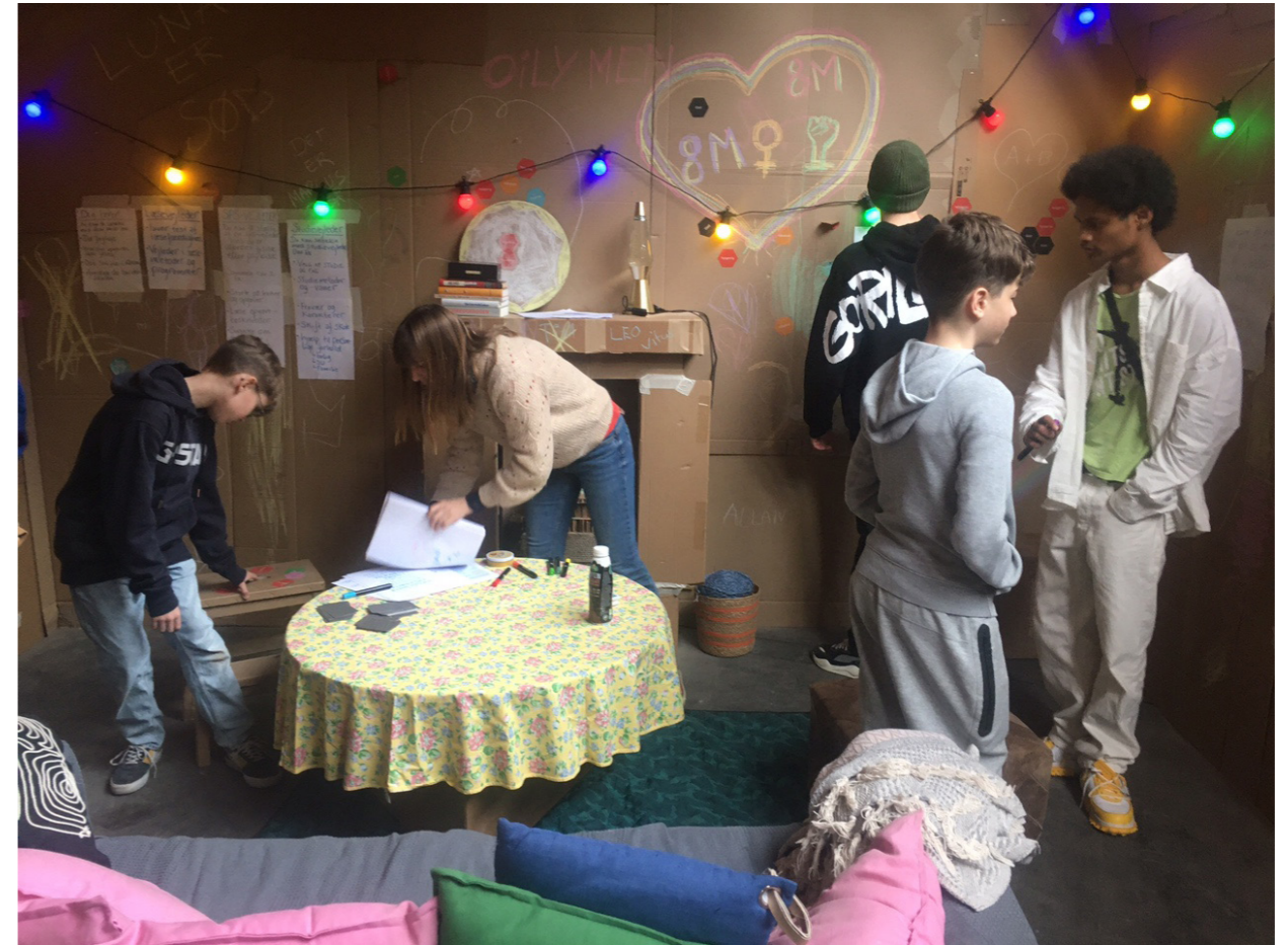
Elever deltager i destinationen “Trivselsfortællinger gennem generationer”.

Der er ingen forslag fra eleverne der helt radikalt omtænker undervisningen bortset fra et par elever, der gerne vil forvandle skolen til fodbold og gaming. Det mest radikale ligger i gruppen af besvarelser, der slet ikke vil skolen og som svar til drømmeskolen fx skriver: “ Ingen skole ”. Fraværet af meget radikale svar kan have flere årsager. Dels kan det udtrykke elevernes manglende adgang og invitation til at gentænke skolen grundlæggende set, så spørgsmålet om ‘drømmeskolen’ svares med det allerede kendte. Dels kan det udtrykke elevernes loyalitet med de voksne, der spørger ind til skolen samtidigt med, at de voksne jo repræsenterer det samfund, der har skabt skolen i sit nuværende format (se mere i afsnit: ‘Noget om noget’).