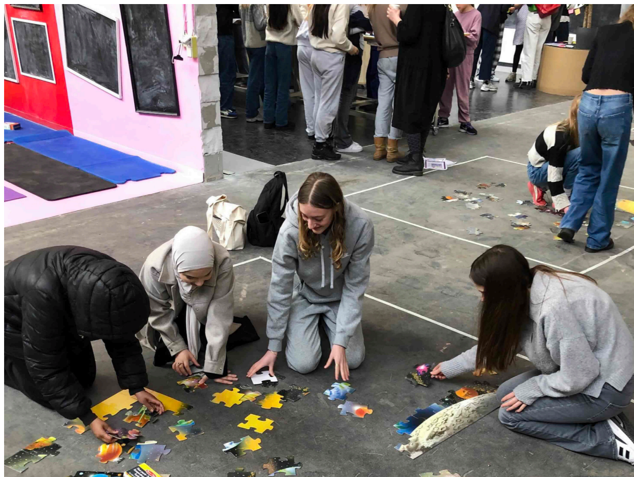
Eleverne får smagsprøver på projektbaseret læring af elever og lærer tilknyttet Vesterbro Ny Skole.

En fjerdedel af besvarelserne peger på pauser og frikvarterer. De ønsker længere og/eller flere frikvarterer. ”Det er dejligt” , siger en elev. En anden peger på, at det er i pauserne, det er sjovt og andre peger på behovet for frisk luft. Enkelte efterspørger konkrete aktiviteter i frikvarteret fx fodbold. Flere peger på, at det bliver nemmere at koncentrere sig eller fokusere, når man har haft frikvarter og dermed peger de også på en dobbelthed, nemlig at timerne er trættende eller kedelige, mens frikvarteret er sjovt og derfor vil de gerne have mere af det. Man kan måske tolke ønske om mere frikvarter, er en spejling af ønsket om mere bevægelse, aktivitet og kreativitet i undervisningen.